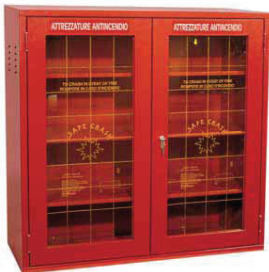
ARMADIO MODELLO MB 102