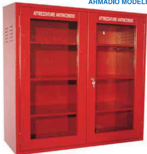
ARMADIO MODELLO MB 102 NF